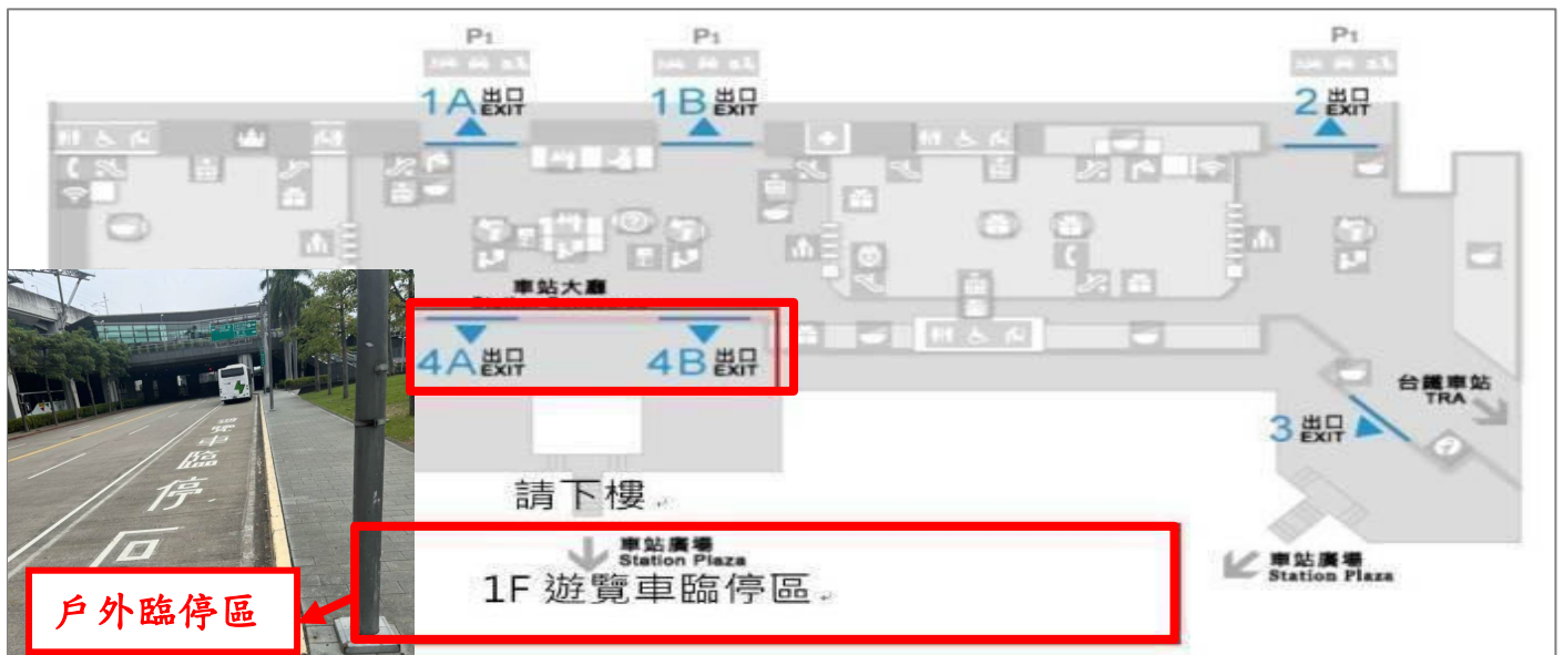
臺中高鐵接駁地點示意圖