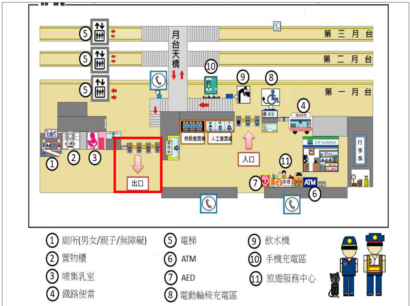
彰化台鐵接駁地點示意圖