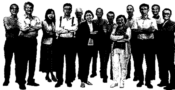
旺宏科學獎評審團陣容堅強