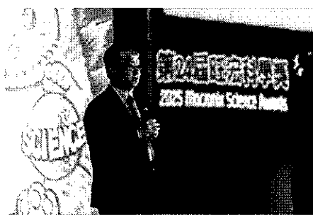
教育部政務次長劉國偉出席活動 給予指導與鼓勵