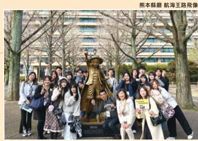
熊本縣廳 航海王路飛像