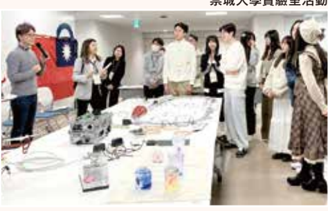
崇城大學實驗室活動

修了本活動的參加者，將授予結業證書 (Certificate of Completion)。此結業證書是日本國際交流活動與文化體驗的證明，可用於學校活動記錄或未來升學活動等。